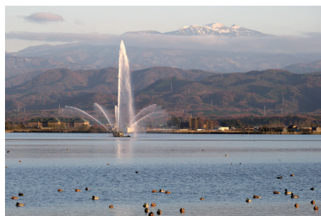
●遊覧船から望む大噴水